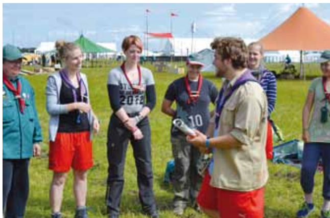
Navneleg for at lære schweiziske og danske navne.