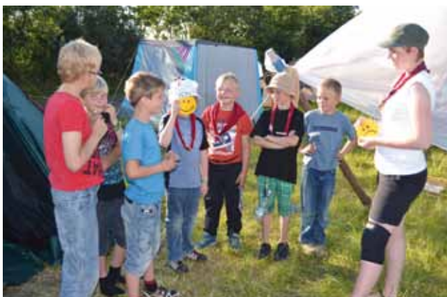
Bævere og ulve får en glad smiley for teltorden.

gøre det en del lettere for familier med flere børn der er spejdere.