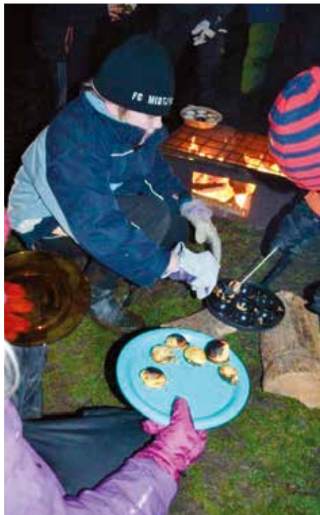
Æbleskiver over bål.

Vi er stolte af arbejdet i vores gruppe. Børn og voksne har det sjovt og griner meget - og vi har et godt og givende fællesskab i ledergruppen/grupperådet. Man føler, at man gør en forskel om så indsatsen er stor eller lille. Det er en fornøjelse at se børnene udvikle sig lidt efter lidt – at være med til at dele deres indsats og deres sejre – både