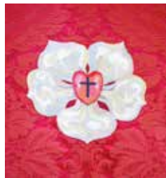
En Lutherrose, Martin Luthers personlige segl, på alterforhænget i Slotskirken i Wittenberg i Tyskland, broderet af Dronning Margrethe i 2016. Slotskirken regnes som udgangspunkt for reformationen. Martin Luther slog 31. oktober 1517 sine kirkekritiske 95 teser op på døren.